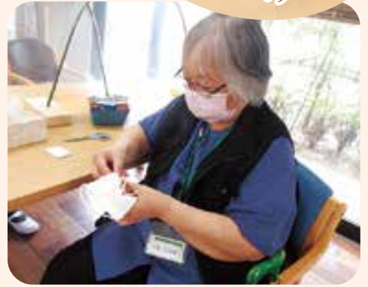
早く新型コロナが落ち着くことを 願いながら、マスクを作りました。