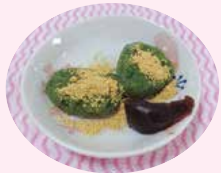
園芸クラブで作った春菊を使い『春菊 団子』を作りました。『よもぎじゃない けど、おいしいなあ』と仰っていました。