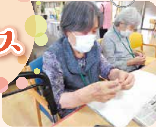
布の袋を作成中です。 皆さん黙々と縫っておられました。