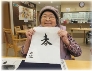
年のはじめの〜♪ 書初め