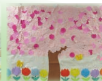
ユニット内を 春に彩ります