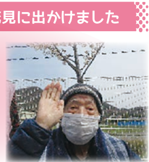
お花見に出かけました