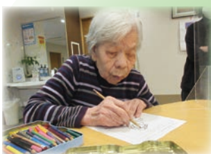
創作活動・脳トレetc 生活習慣を大切に