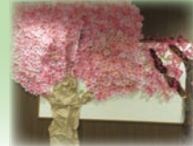
600枚の 桜の花びらで作りました