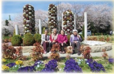
3月には青山の公園へ 梅の花も見に行きました♪