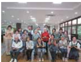
苔テラリウム作り

平成30年5月20日(日)に『園芸療法』で苔テラリウム作りを、7月15日(日)に『音楽療法』を開催いたしました。苔テラリウム作りでは、みなさん時間の経つのも忘れ真剣に作っておられました。音楽療法では、季節の唄を唄ったり、音楽に合わせて簡単な運動を行い心身共にリフレッシュしました。大変暑い中ご参加していただきありがとうございました。今後も、季節を感じ楽しんでいただけるように開催してまいりますので、是非ご参加お待ちしております。