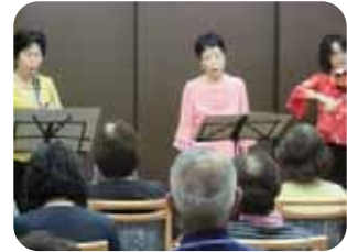
第2回予防教室の様子

第4回の介護予防教室はリハビリテーションをテーマに考えております。詳細が決まり次第、広報誌や回覧等で地域の皆様にご案内致します。