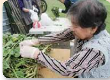
太子町の枝豆を収穫

細かい作業が得意な方、色の配置を考えて下さる方...皆様の力の結集で大きな作品となりました。