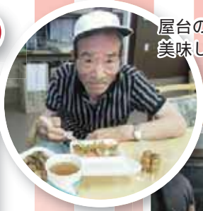
屋台のたこ焼き、やきそば 美味しかったあ!!