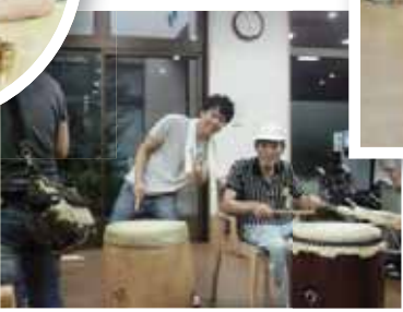
太鼓をドンドン! 楽しく参加されました