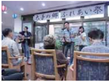
太子の郷の名バンド ライブは盛り上がりました