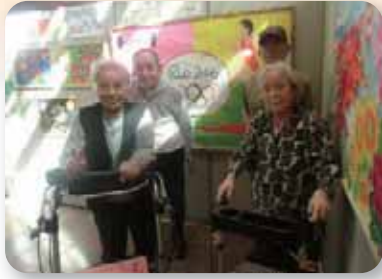
太子町町民芸術祭

細かい作業が得意な方、色の配置を考えて下さる方...皆様の力の結集で大きな作品となりました。