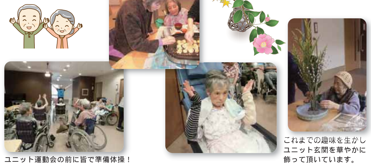
ユニット運動会の前に皆で準備体操！