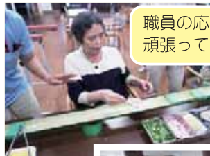
職員の応援を受け、頑張って掴まれました。