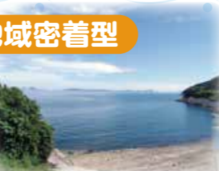
外出：海（道の駅 みつ）