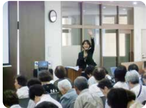
平成27年6月開催の予防教室の様子