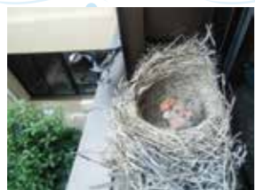
二階の窓の外に、鳥の巣ができていました。